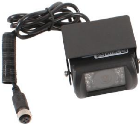
Analog-Kamera - Nur 202 €